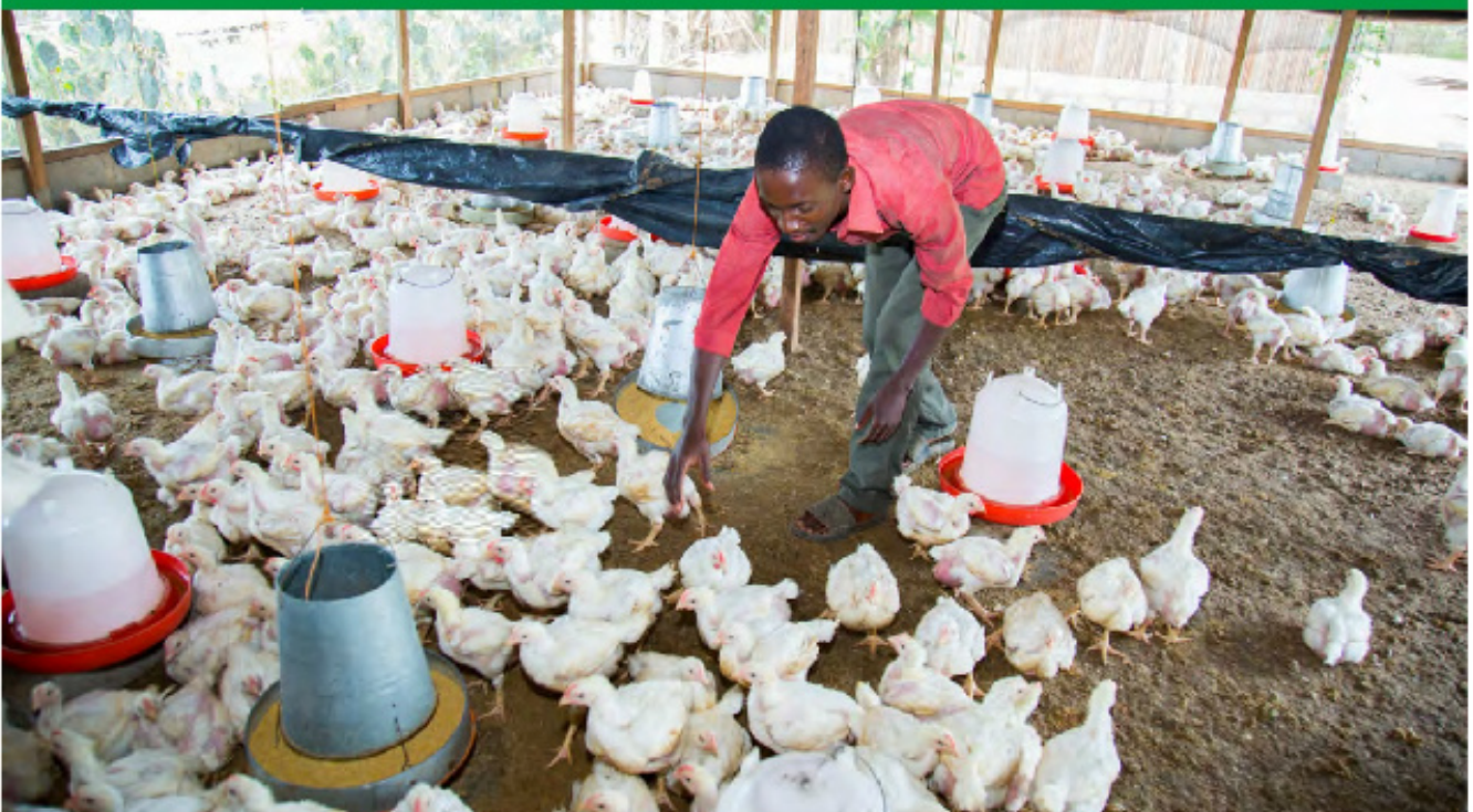
Jeune homme bénéficiaire du Programme Emploi-Jeunes à Jacquville