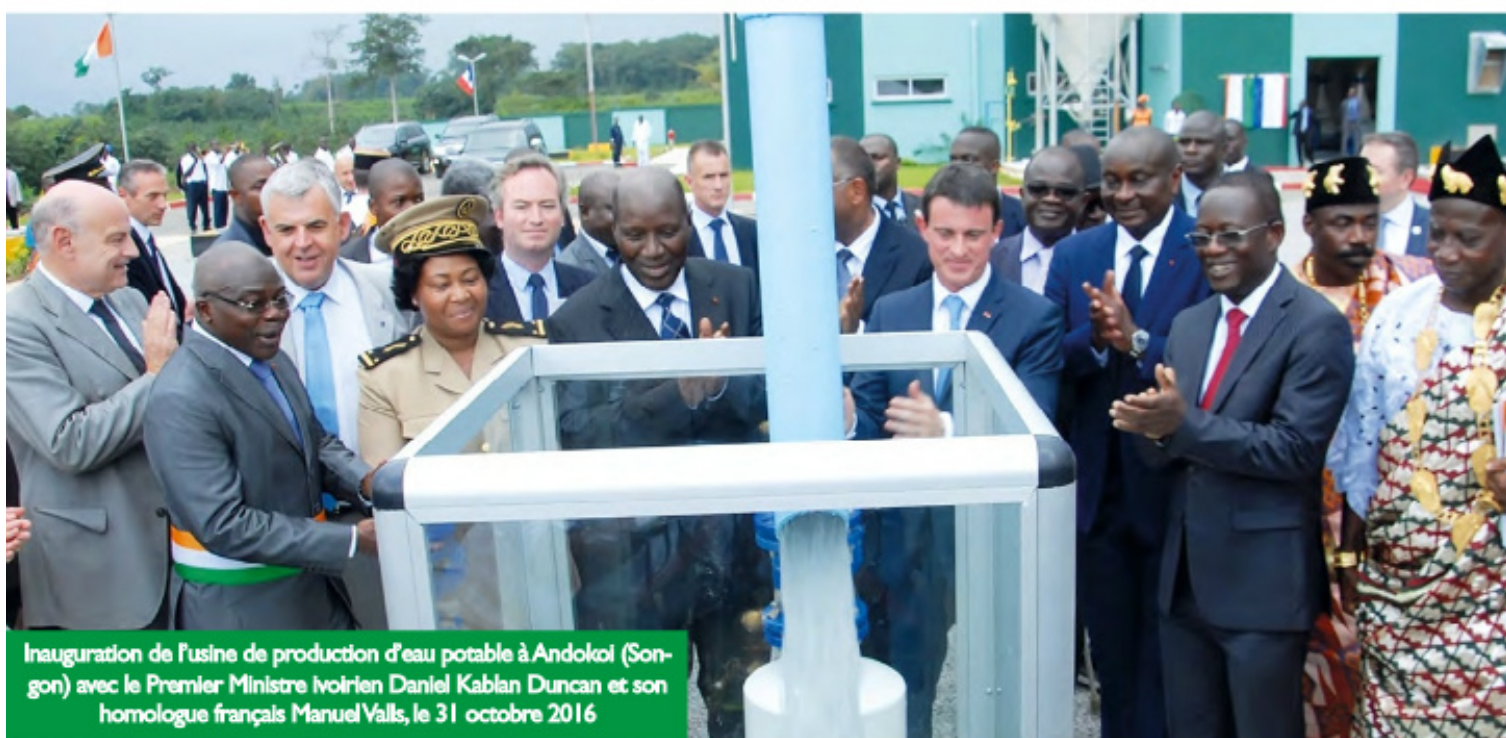
Inauguration de l'usine de production d'eau potable à Andokoi (Songon) avec le Premier Ministre ivoirien Daniel Kablan Duncan et son homologue français Manuel Valls, le 31 octobre 2016

L'usine ainsi financée par le C2D permet d'améliorer considérablement la distribution de l'eau potable dans le District d'Abidjan notamment dans les localités d'Abobo N'dotré, Yopougon, ou d'Anyama.