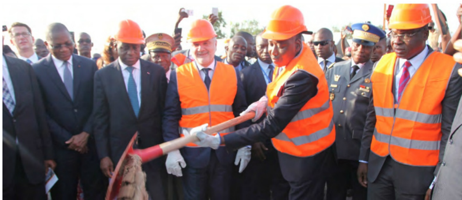
Lancement des travaux de renforcement de la route Bouaké - Ferké

PM : Cette question est importante dans la mesure où le but recherché par ce type de programme est de contribuer à l'amélioration des conditions de vie des populations. Que ce soit du côté de nos partenaires français que du nôtre, nous pouvons nous féliciter car les projets ont été choisis de façon judicieuse de sorte qu'aujourd'hui les retombées du C2D sont multiples