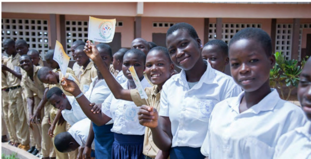
Des élèves bénéficiaires d'un collège de proximité à Lataha (Région de Korhogo)

Pour garantir la qualité de la formation des formateurs, l'Institut Pédagogique National de l'Enseignement Technique et Professionnel (IPNETP) d'Abidjan sera réhabilité et renforcé. Au niveau de l'enseignement supé-