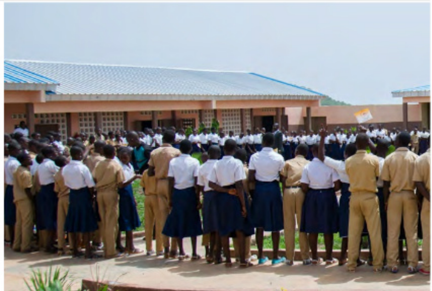
Des élèves bénéficiaires d'un collège de proximité à Lataha (Région de Korhogo)

Le slogan « Avec le C2D Construisons le développement de demain » est bien en marche dans le secteur Education-Formation.