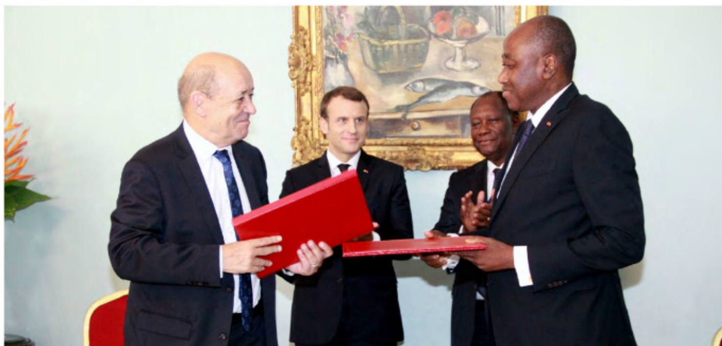
Appui Budgétaire 2017 : échange de parapheurs entre les parties ivoirienne et française

PM : le principe d'un 3 ème C2D est acquis entre les gouvernements français et ivoirien. La tenue de la 3 ème réunion du COS, en marge de la journée-bilan, sera l'occasion pour nos deux parties d'arrêter conjointement les modalités de préparation et de signature d'un 3 ème C2D. En tout état de cause, la flexibilité qui a caractérisé cet instrument financier pour la prise en compte de certaines urgences devra toujours prévaloir en vue d'assurer une meilleure réponse à la demande sociale.