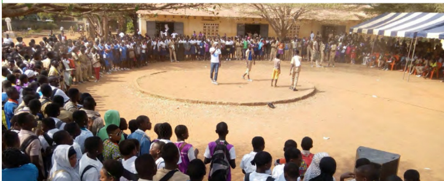
Sensibilisation de masse au lycée moderne de Man par une clinique juridique de l'AFJCI, le 17 Janvier 2018

Pour toutes ces réalisations, le budget du 1er C2D est de 15,1 Mds FCFA et celui du 2ème C2D s'élève à 40,6 Mds FCFA.