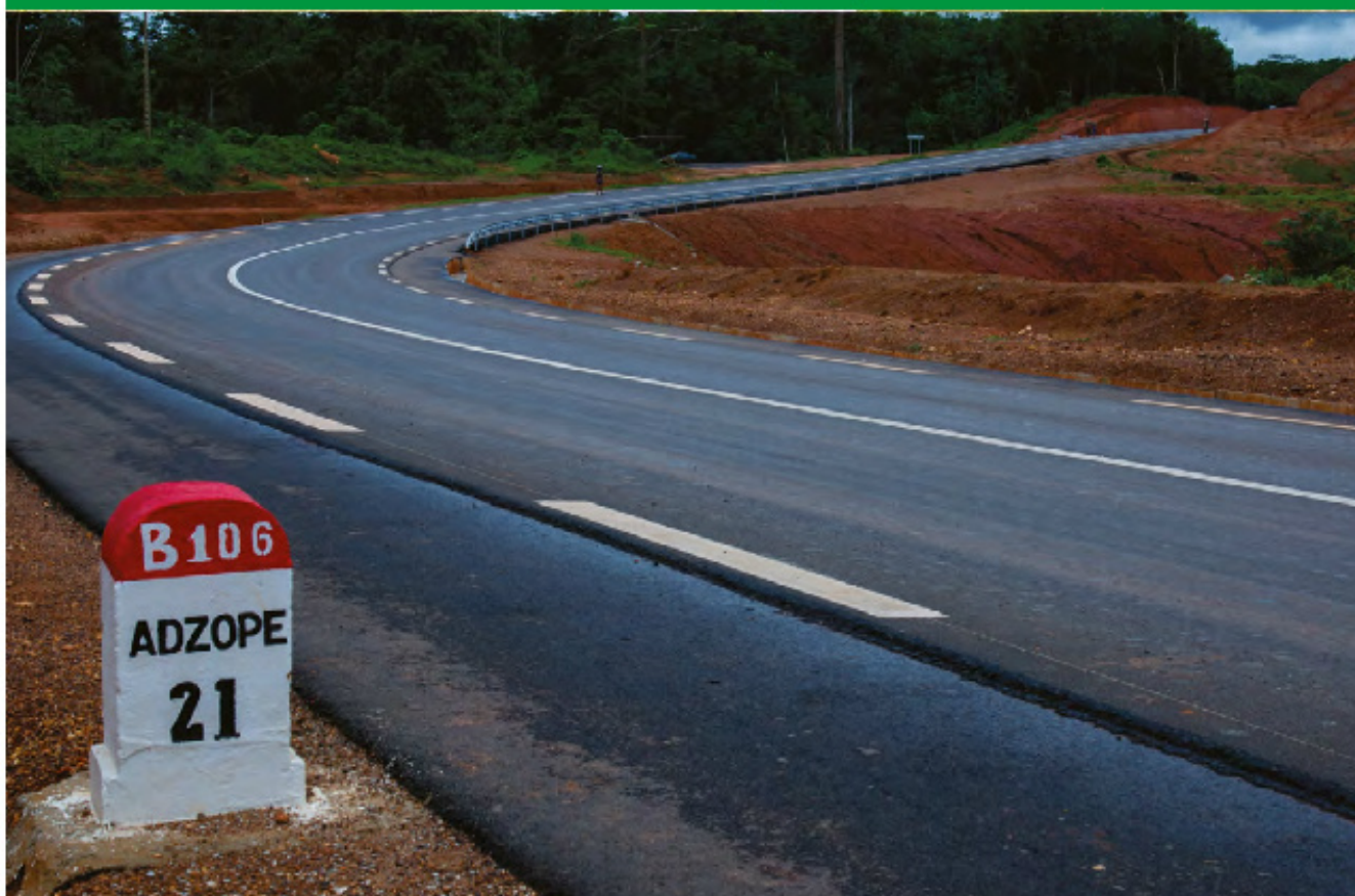
La construction de la route Adzopé-Pont Comoé