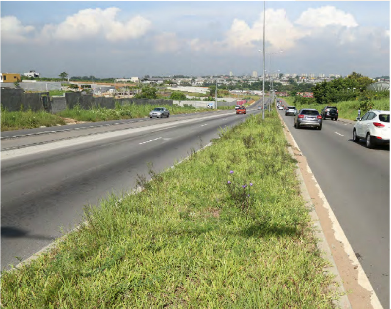
Une circulation améliorée sur le boulevard de France redressé