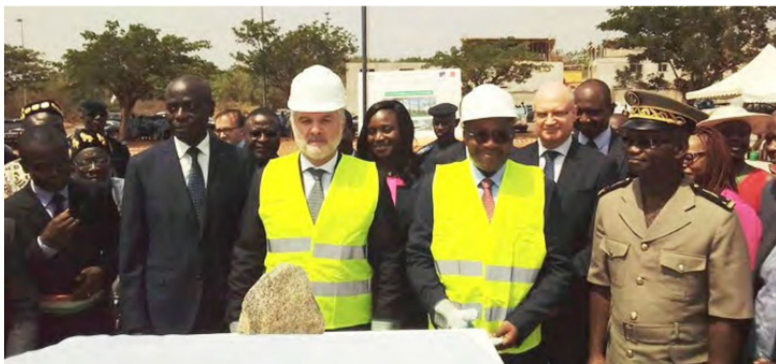
Pose de la première pierre de l'INFJ de Yamoussoukro en présence du Ministre Sansan Kambilé, de l'ambassadeur Gilles Huberson et du Gouverneur Augustin Thiam

L'Institut National de Formation Judiciaire a pour ambition de former 500 étudiants par an. En formation continue, sa capacité prévisionnelle est de 2030 étudiants par an. D'un coût global de 11 Mds FCFA, la construction, qui a démarré en mars 2018, doit prendre fin en septembre 2019.