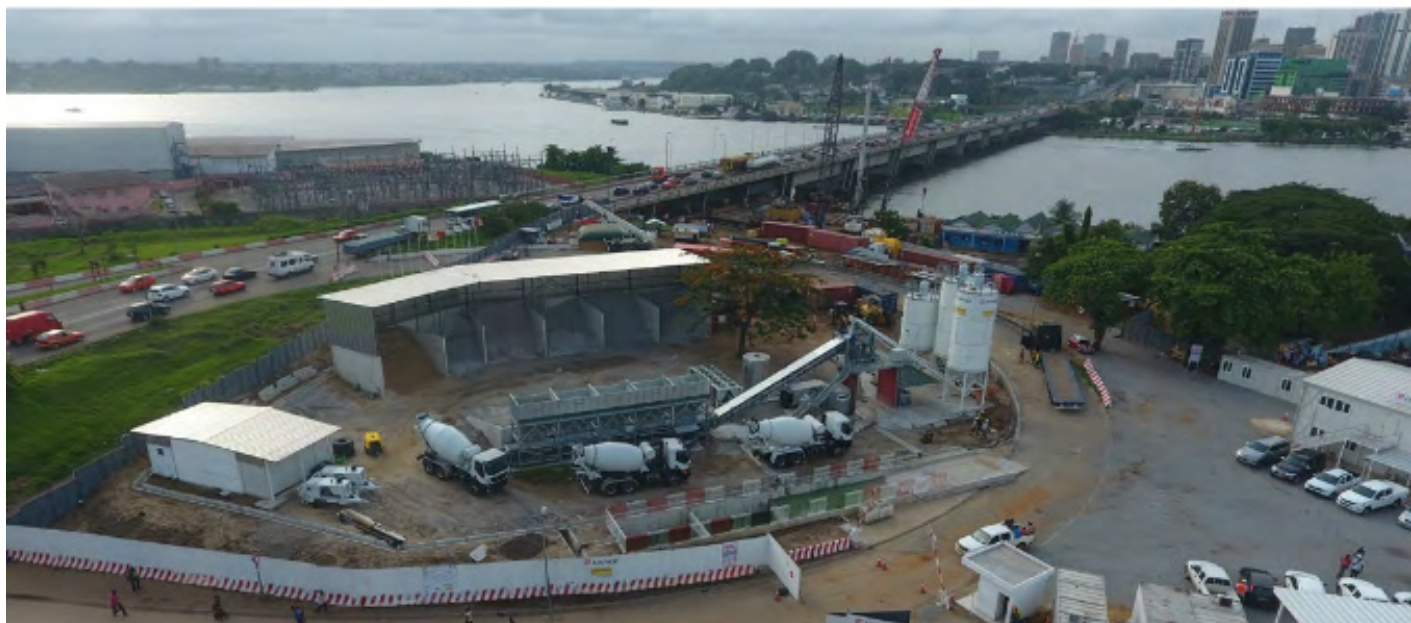
Une vue aérienne du chantier de réhabilitation du pont Houphouët-Boigny

Construit entre 1953 et 1957, le pont Félix Houphouët-Boigny est un ouvrage à double étage de 372 m de long, qui n'a bénéficié d'aucune intervention lourde d'entretien, depuis sa mise en service. Dans le cadre du 2 ème C2D, les autorités ivoiriennes et françaises ont convenu du financement de la réhabilitation de cet ouvrage d'art.