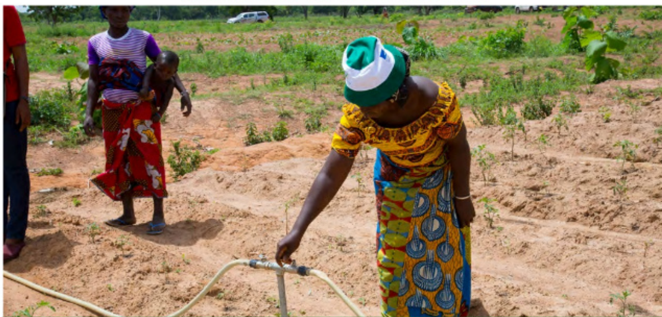
Site de maraîchers équipé d'un système d'irrigation à Lavononkaha S/P de Karakoro (Région du Poro)

Conformément aux axes prioritaires du Plan National de Développement (PND), et du Plan National d'Investissement Agricole (PNIA), les décideurs du C2D ont autorisé le financement, dès 2012, du secteur de l'agriculture, du développement rural et de la biodiversité pour un montant global de 51,8 Mds FCFA pour le 1 er C2D et de 80 Mds FCFA pour le second.