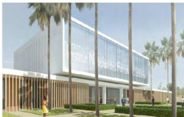
La maquette de l'Institut National de formation Judiciaire de Yamoussoukro

« La construction de cet Institut revêt un enjeu majeur pour le plan d'action du gouvernement, non seulement pour tenir compte de l'amélioration des infrastructures escomptée, mais également parce que regardée par les partenaires au développement comme un indicateur de bonne gouvernance ».