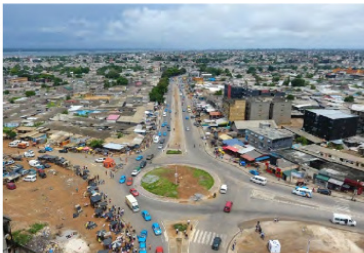
Yopougon : La voie Palais de Justice - koweit