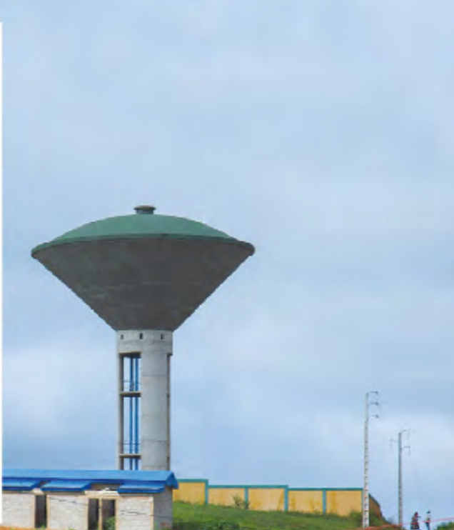
Le chateau d'eau de Duékoué : une ménagère heureuse de voir l'eau couler de son robinet