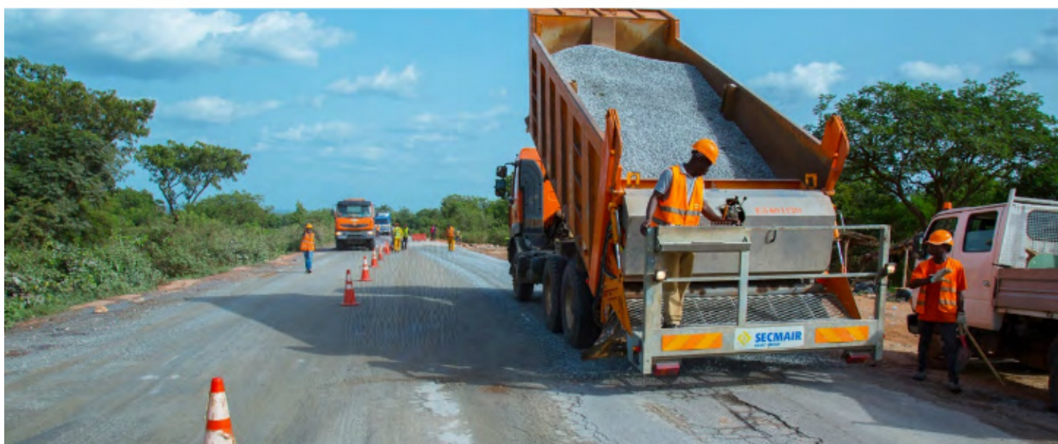
Route Bouaké - Ferké en cours de travaux

Le 11 novembre 2017 à Katiola, le Premier Ministre Amadou Gon COULIBALY a lancé les travaux de réhabilitation de ce tronçon de la route du Nord. La date prévisionnelle de fin des travaux est fixée au 30 décembre 2019.