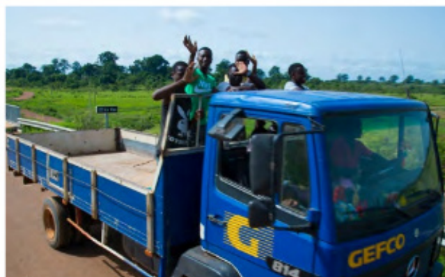
Pont sur la rivière Kan (affluent du Bandama)

D'un coût global de 16 Mds FCFA, la réalisation du pont de Béoumi permet d'atteindre Bouaké, située à une centaine de kilomètres. Les populations des régions du Béré (Mankono) et de Worodougou (Séguéla) parcouraient auparavant plus de 250 km en passant par Daloa et Yamoussoukro. Cet exemple est révélateur de l'importance de ce pont qui rapproche des populations et régions voisines, et aussi les régions du centre du pays au Nord.