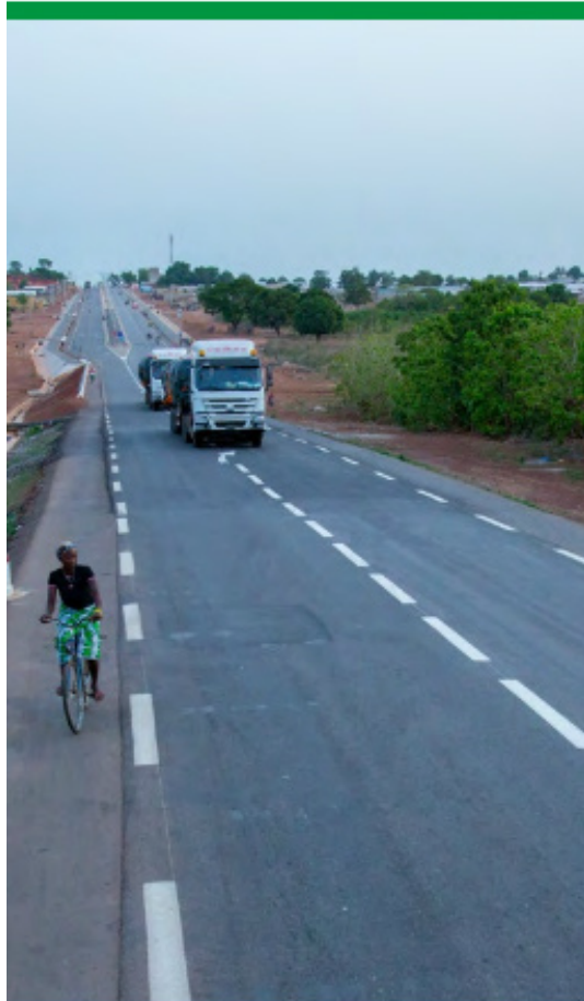
Route Ferké - Ouangolo renforcée

Les projets d'infrastructures occupent une place prépondérante dans les actions du C2D, du fait de leur visibilité et de leur capacité de mobilisation des ressources.