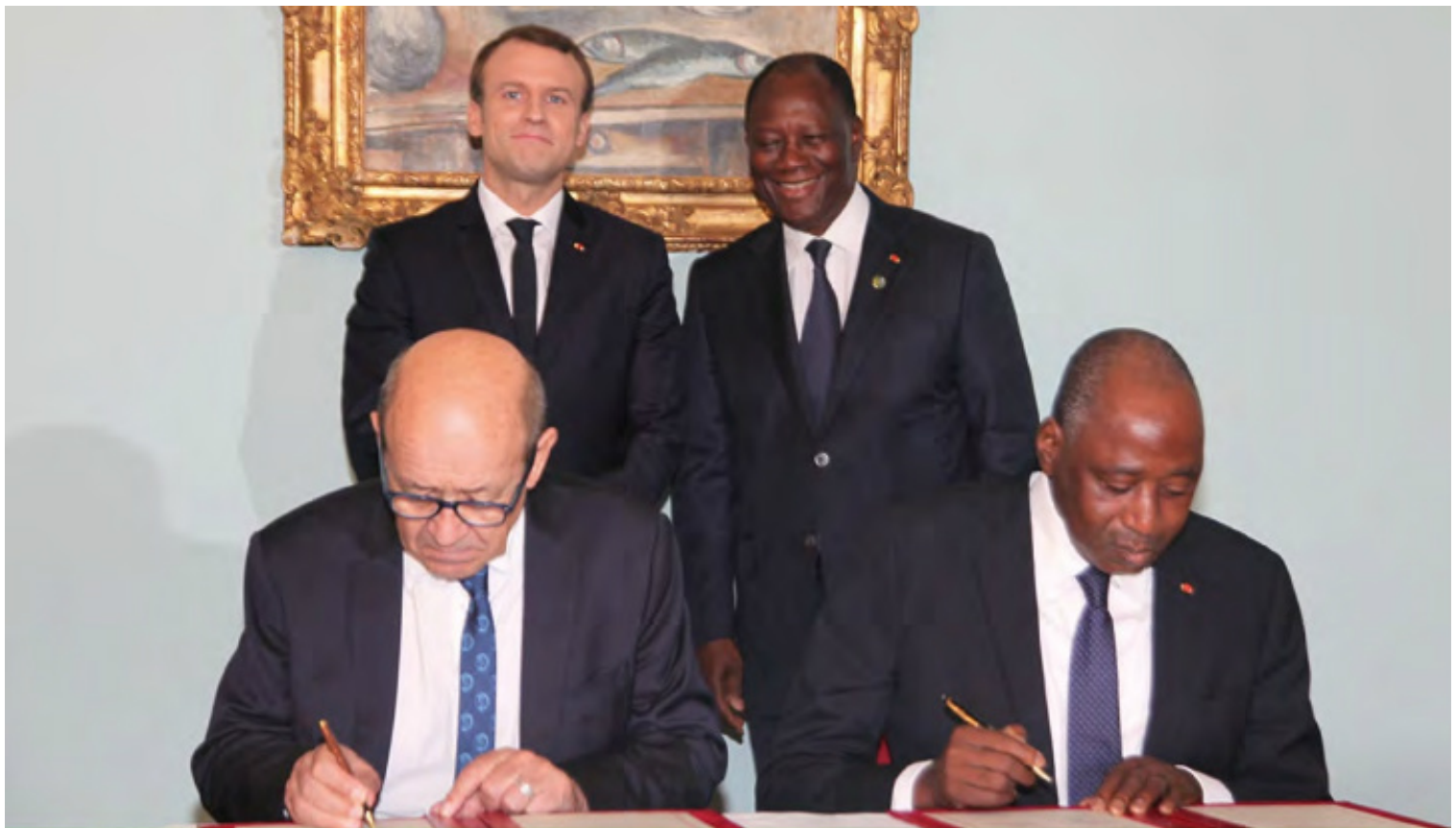
Signature de l'avenant au 2 ème C2D entre les Etats Français et Ivoirien au Palais Présidentiel, le 30 novembre 2017