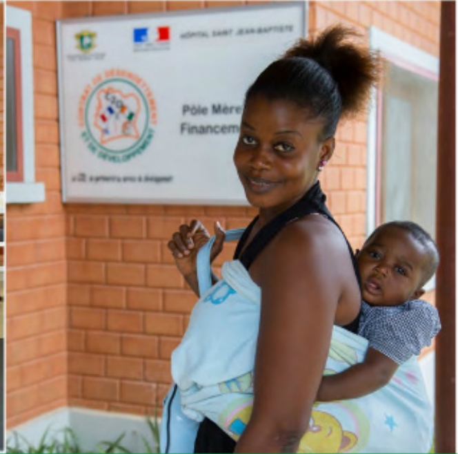
Pôle Mère-Enfant de l'hôpital Saint Jean Baptiste de Tiassalé financé par le C2D

Politique de Planification Familiale (PIPPF) a également bénéficié des financements du C2D. Ses actions concernent la sensibilisation et l'encadrement des populations pour la planification familiale sur toute