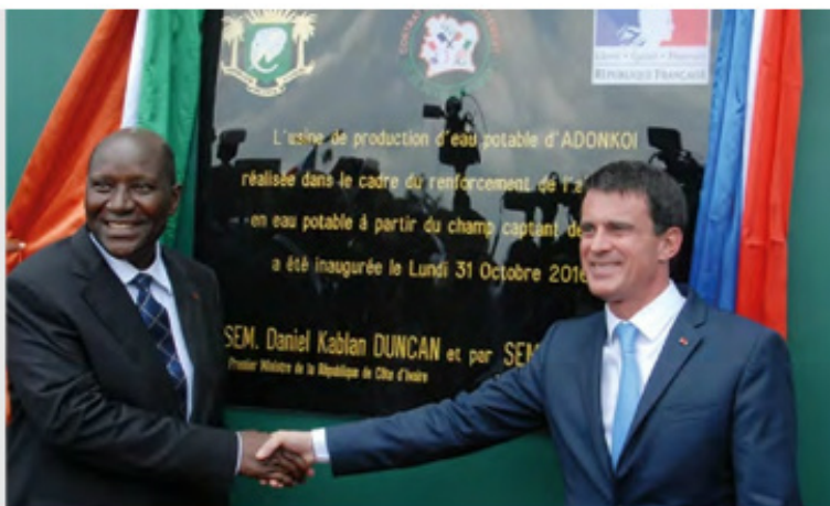
Les Premiers Ministres ivoirien et français devant la plaque commémorative

En effet, c'est le 31 octobre 2016 que l'usine et ses différentes infrastructures ont été inaugurées conjointement par les Premiers Ministres Daniel Kablan DUNCAN de Côte d'Ivoire et son homologue français, Manuel VALLS.