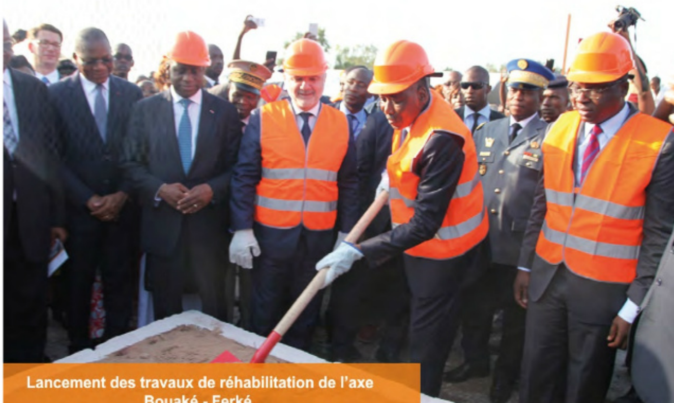
Lancement des travaux de réhabilitation de l'axe Bouaké - Ferké, le samedi 11 novembre 2017 à Katiola