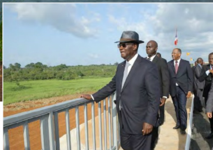
Inauguration du pont de Béoumi sur le fleuve Bandama et sur le Kan le 2 octobre 2015, par SEM le Président de la République

E n Côte d'Ivoire, le pont de Béoumi figure incontestablement au nombre des grands projets d'infrastructures réalisés grâce au financement du C2D.