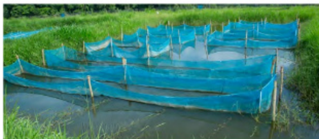
Des étangs piscicoles au CNRA de Bouaké

En outre, un fonds d'appui à l'innovation permet de financer, par appel à projets, des projets de recherche-appliquée. Le premier appel à projets lancé en avril 2017 a permis le financement de 15 projets dans 11 filières agricoles à hauteur de 2,5 Mds FCFA. Et pour le second appel à projets, encore en cours, 9 dossiers ont été retenus. Les autres composantes de ce vaste programme concernent la production du cacao dans le respect des forêts à travers la mise en œuvre d'un projet dénommé « cacao ami des forêts », la poursuite du projet REDD+ débuté sur les fonds du 1 er C2D et la mise en place d'une coordination de gestion des risques liés à la sécurité sanitaire des aliments.