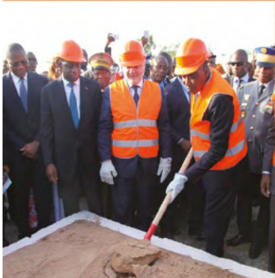
Lancement des travaux de réhabilitation de l'axe Bouaké - Ferké, le samedi 11 novembre 2017 à Katiola.