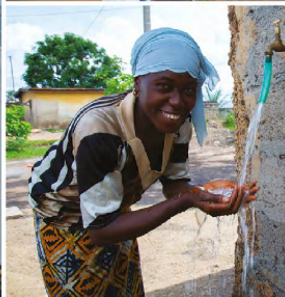
Ces mini-chateaux produisent de l'eau dans la cour de cette femme et dans la ville de Guiglo