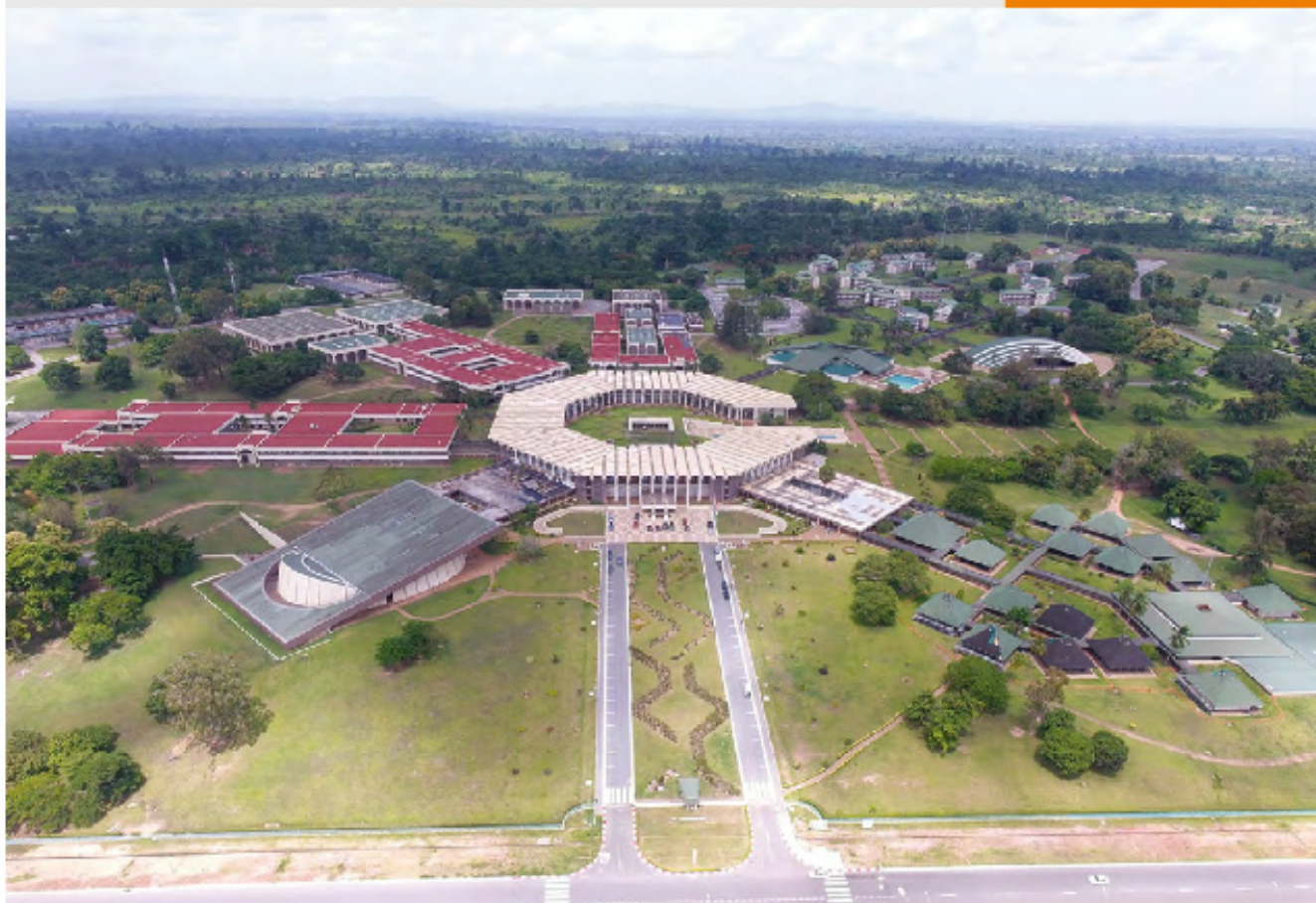
Rénovation des toits du célèbre Institut Polytechnique de Yamoussoukro