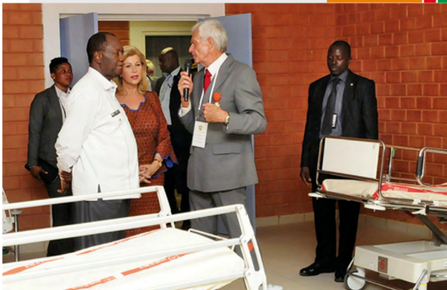
Le Couple Présidentiel ivoirien lors de l'inauguration de l'hôpital Saint Jean-Baptiste de Tiassalé